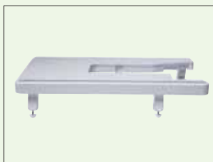
Table d'extension Vergrößert die Auflagefläche und erleichtert die Handhabung von großen Stoffteilen und Quilts.

Bibliothèque de cartes de broderie Des centaines de motifs extraordinaires !